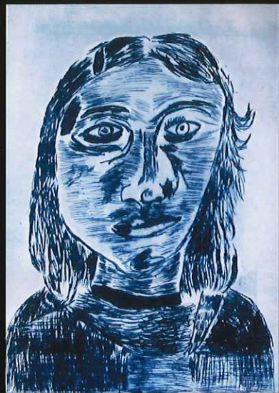
ひとりひとりのものがたり