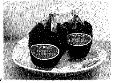
写真：コーヒーゼリー

夏本番を迎え、暑い日が続いていますね。そんな暑い日に、冷たいコーヒーゼリーで一息つきませんか？ 濃厚なコーヒーの苦みとさっぱりした甘さで、のどごしも良く食欲のない時にもつるんと食べることができます。スプーンで食べるのはもちろんストローで飲むのもおすすめ。9月末までの限定商品なので是非お試しください！！