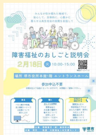
堺市共催の福祉職就職フェア開催