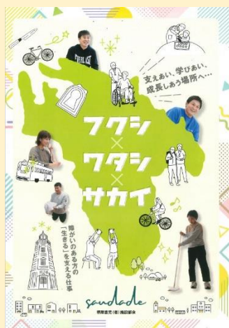
参画法人による紹介パンフレット

障がい福祉は共生社会実現へ向けた価値の高い働き甲斐のある仕事です。この事業を通じ、興味をおもちの皆さまに安心して求職そして就職いただけるよう、労働環境が十分に整備された現在の福祉業界をアナウンスしていきます。